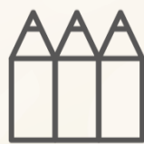
LÁPICES DE COLORES