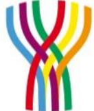
Llegada de Visitantes con Pernocta (Periodo Julio - Septiembre 2018)